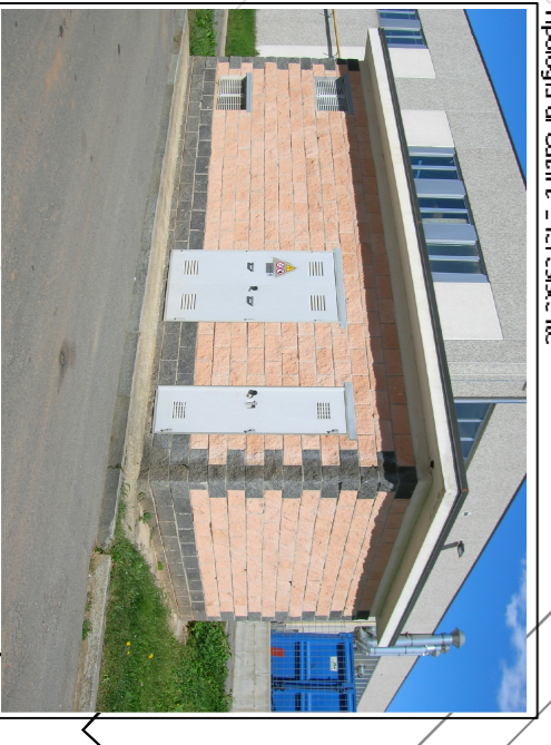
Tecnologia di Culture 21st Residence