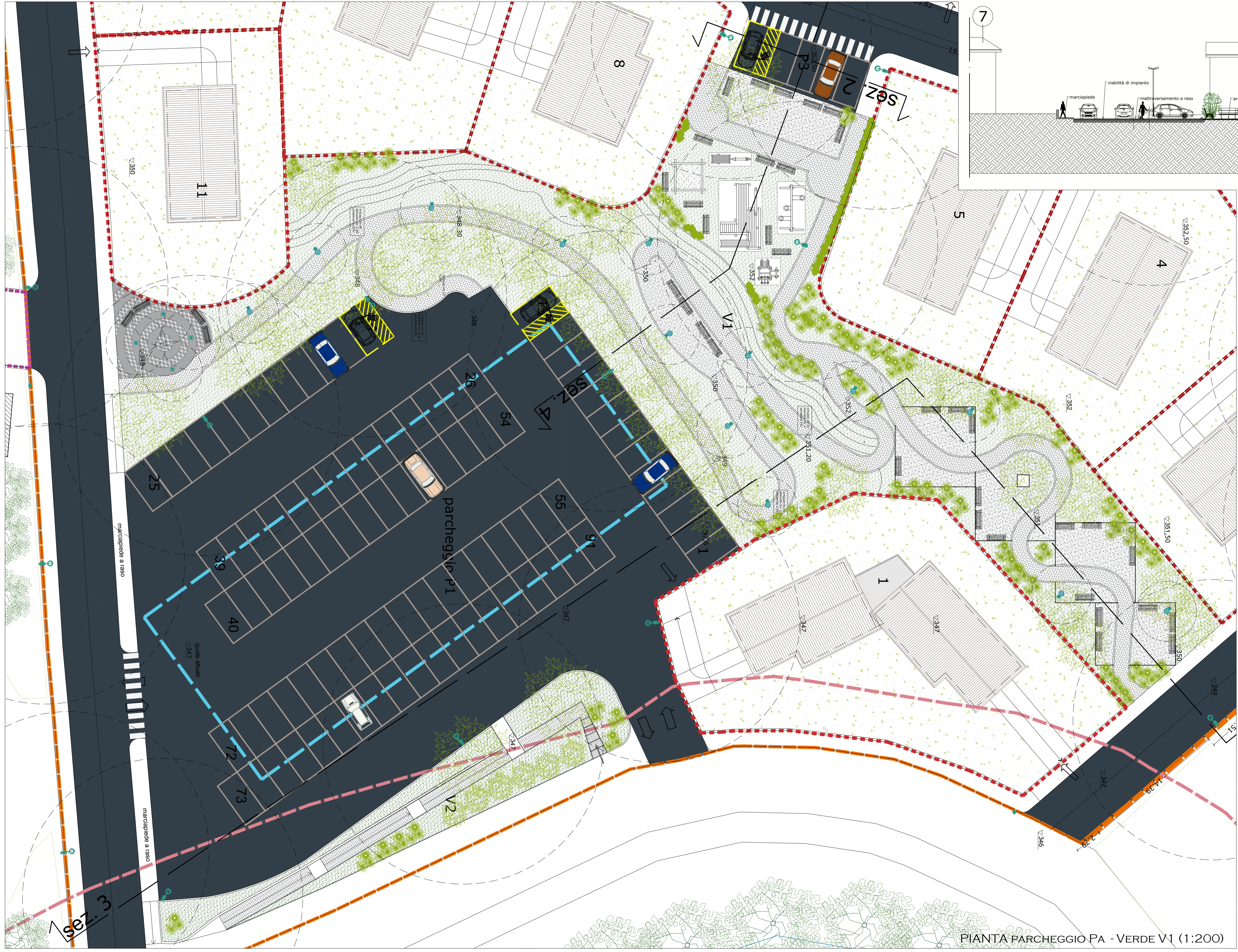
PIANTA PARCHEGGIO PA - VERDE V1 (1:200)