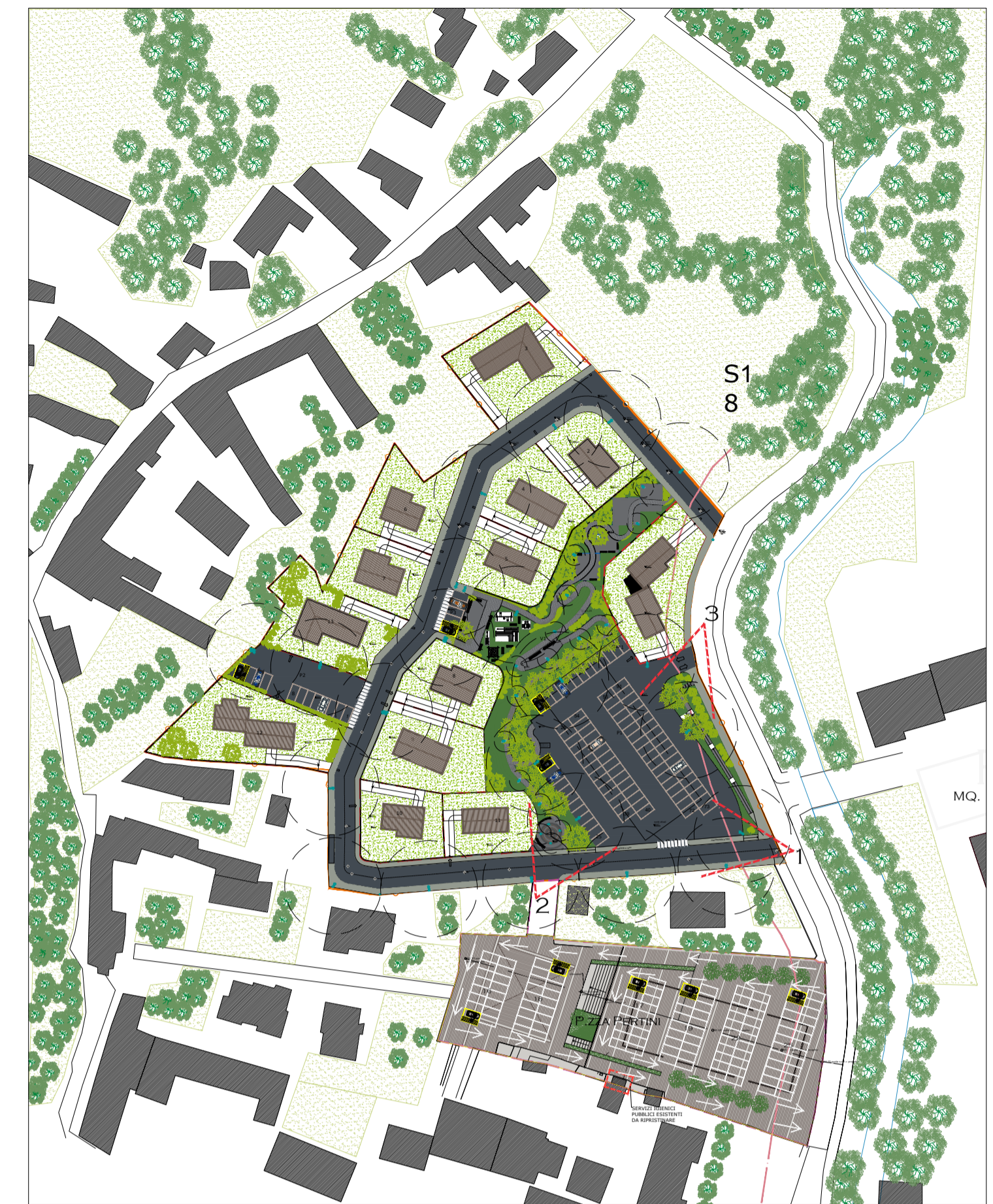
POSIZIONE DELLE VISTE RENDERIZZATE