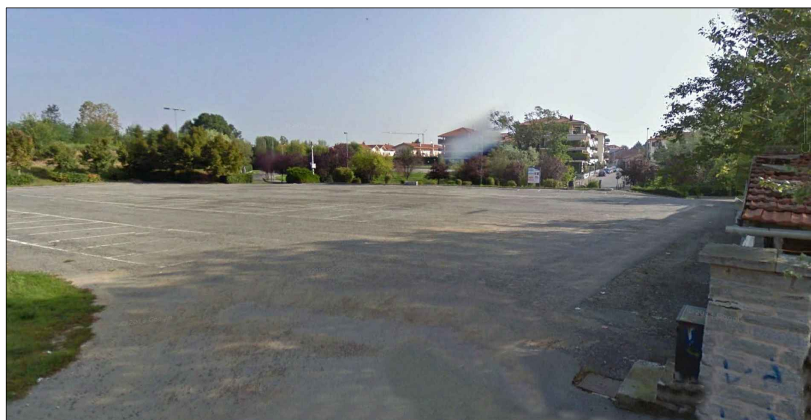
2 STATO DI FATTO