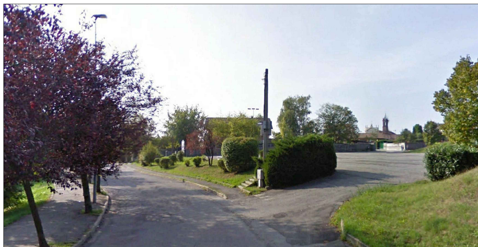
3 STATO DI FATTO