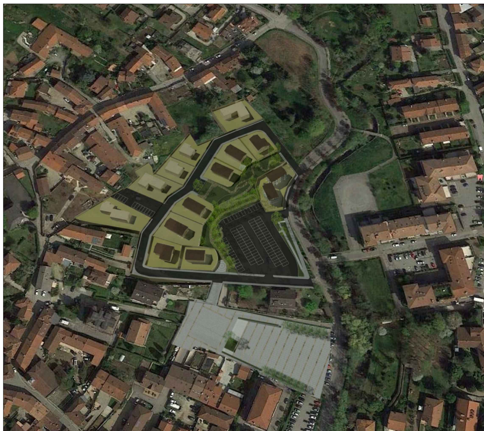
SIMULAZIONE DEL PROGETTO: VISTA DALL'ALTO DELL'AMBITO DI INTERVENTO