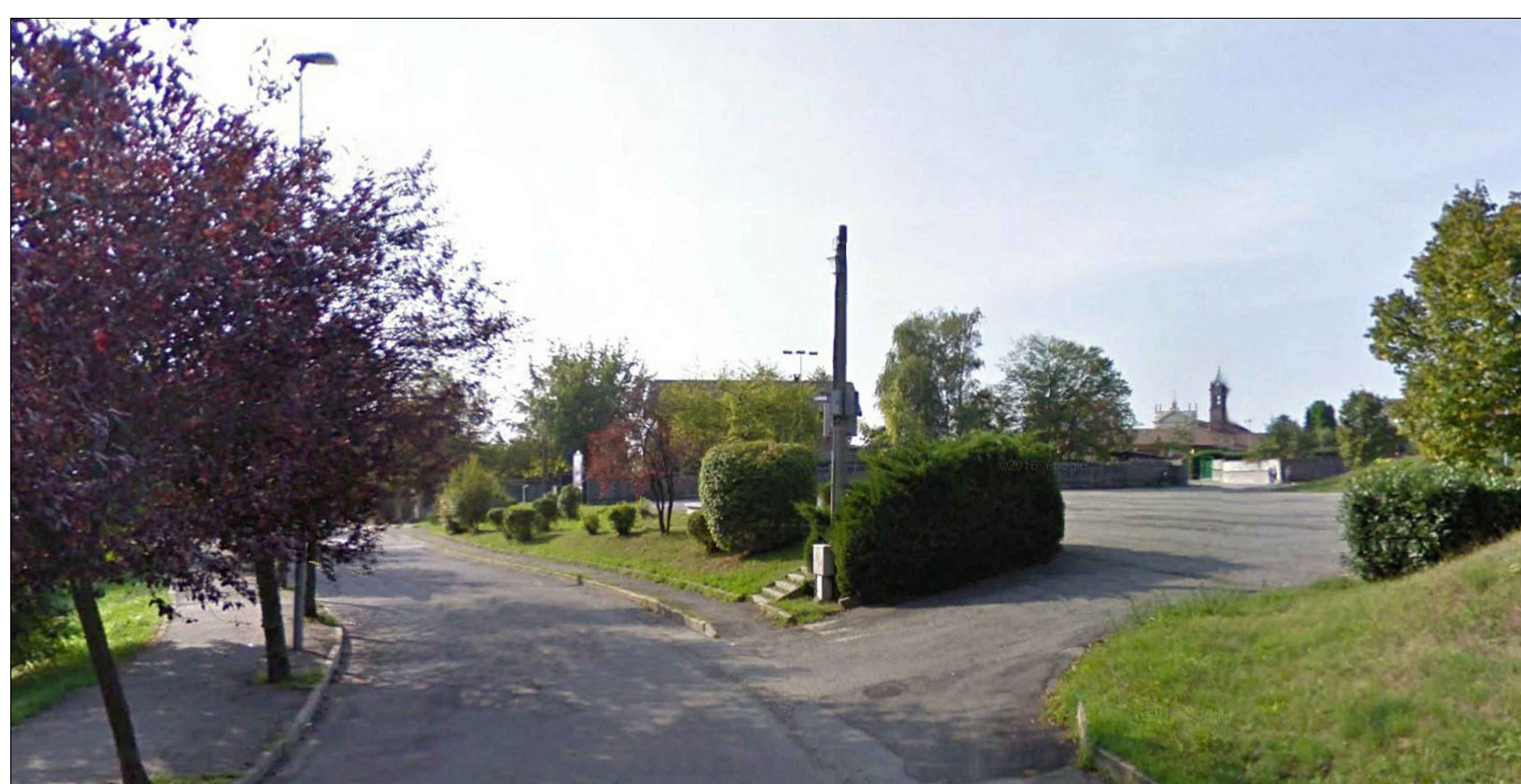
3 STATO DI FATTO