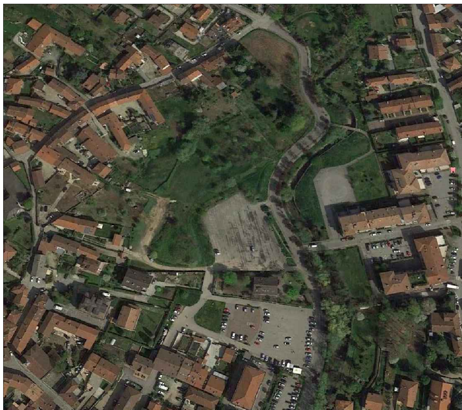
STATO DI FATTO: VISTA DALL'ALTO DELL'AMBITO DI INTERVENTO