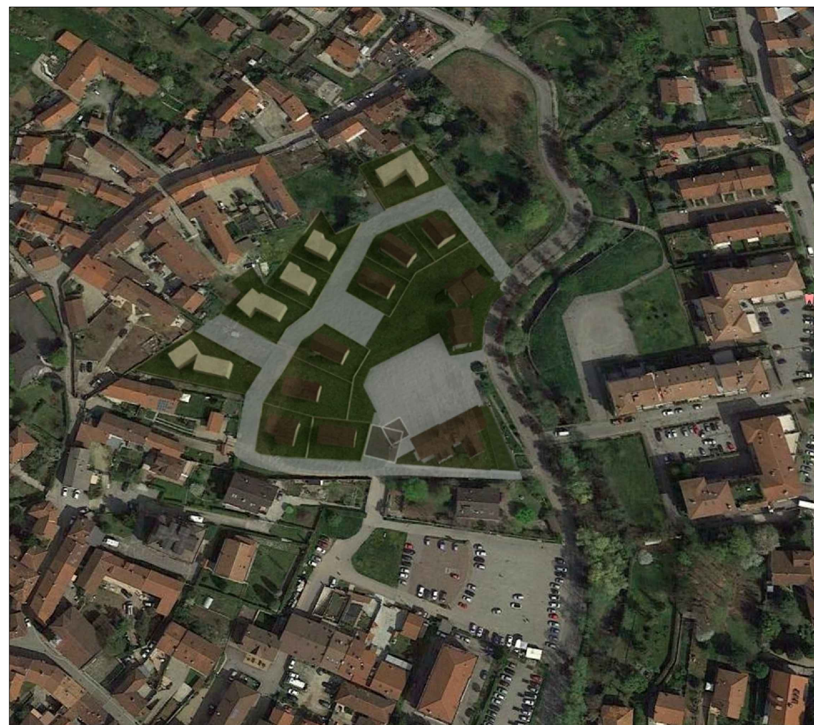
SIMULAZIONE DEL PROGETTO: VISTA DALL'ALTO DELL'AMBITO DI INTERVENTO