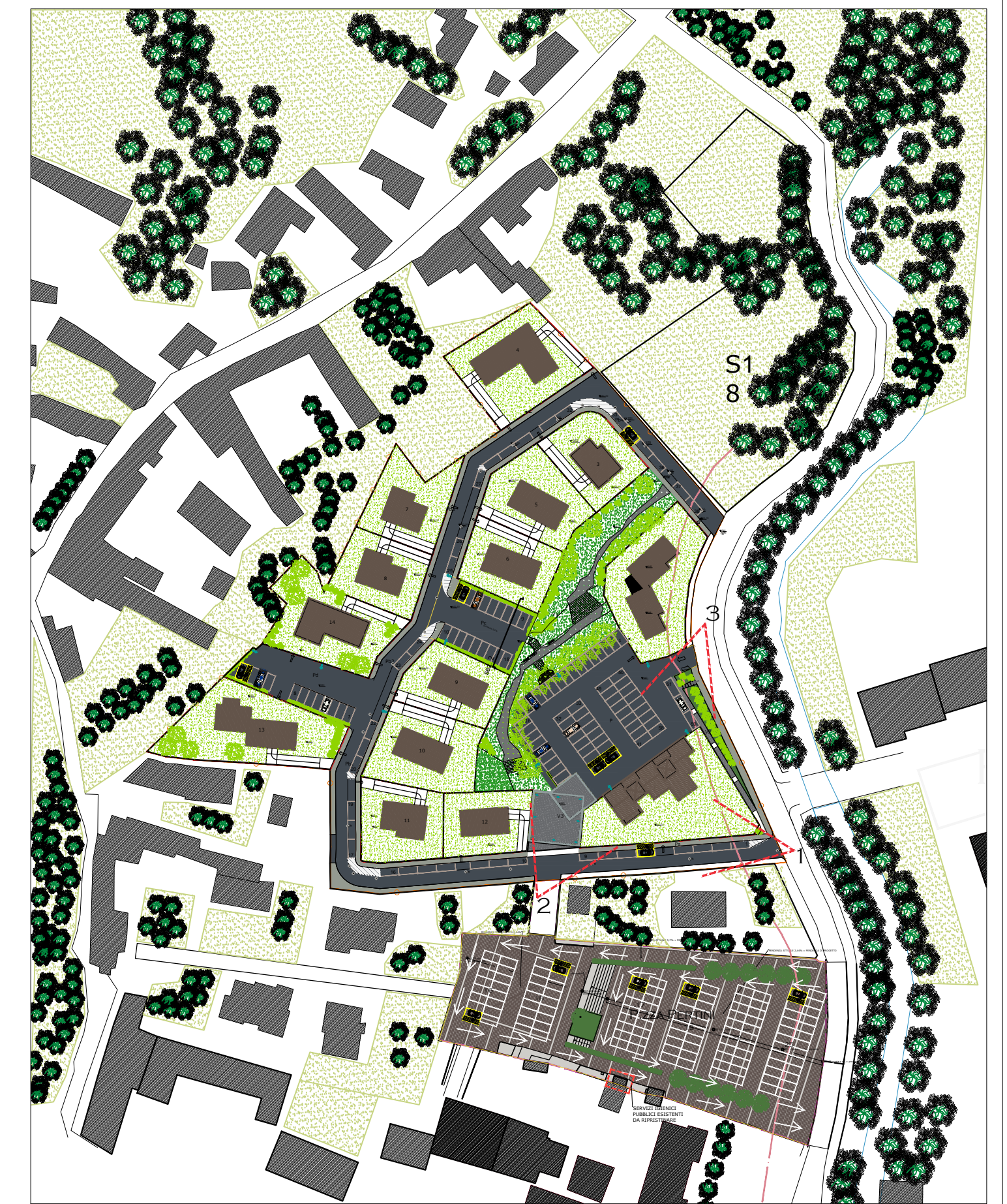
POSIZIONE DELLE VISTE RENDERIZZATE