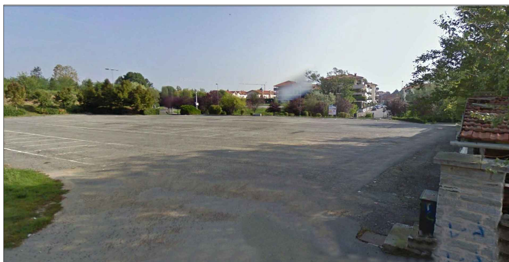
2 STATO DI FATTO