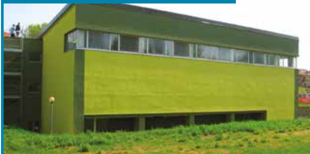
SCUOLA MEDIA PARRI