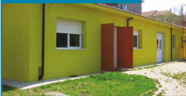
SCUOLA MATERNA ANDRESEN

Sono iniziati gli interventi volti alla riqualificazione e al miglioramento dell'efficienza energetica degli edifici scolastici inseriti nell'ambito del "progetto 2020 Together". Il progetto è stato attivato grazie ad un co-finanziamento europeo che ha coinvolto 11 Comuni dell'Area Metropolitana di Torino. Gli interventi non hanno previsto costi a carico dei comuni, in quanto, le spese sostenute dalla ditta concessionaria saranno compensate con il risparmio di spesa, sui costi di fornitura di gas naturale ed energia elettrica, ottenuto a seguito del minor consumo realizzato grazie alla riqualificazione energetica.