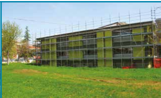
SCUOLA MATERNA MONTESSORI