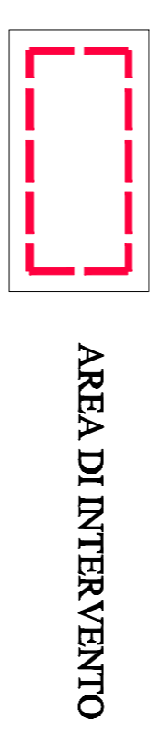
AREA DI INTERVENTO

Comune: COMUNE DI PIOSSASSO Provincia di Torino