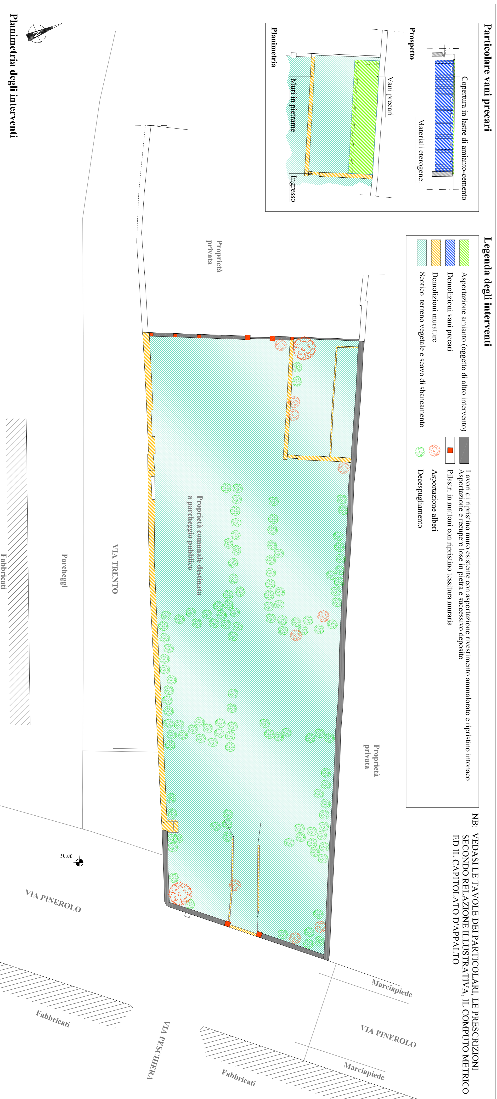
Planimetria degli interventi