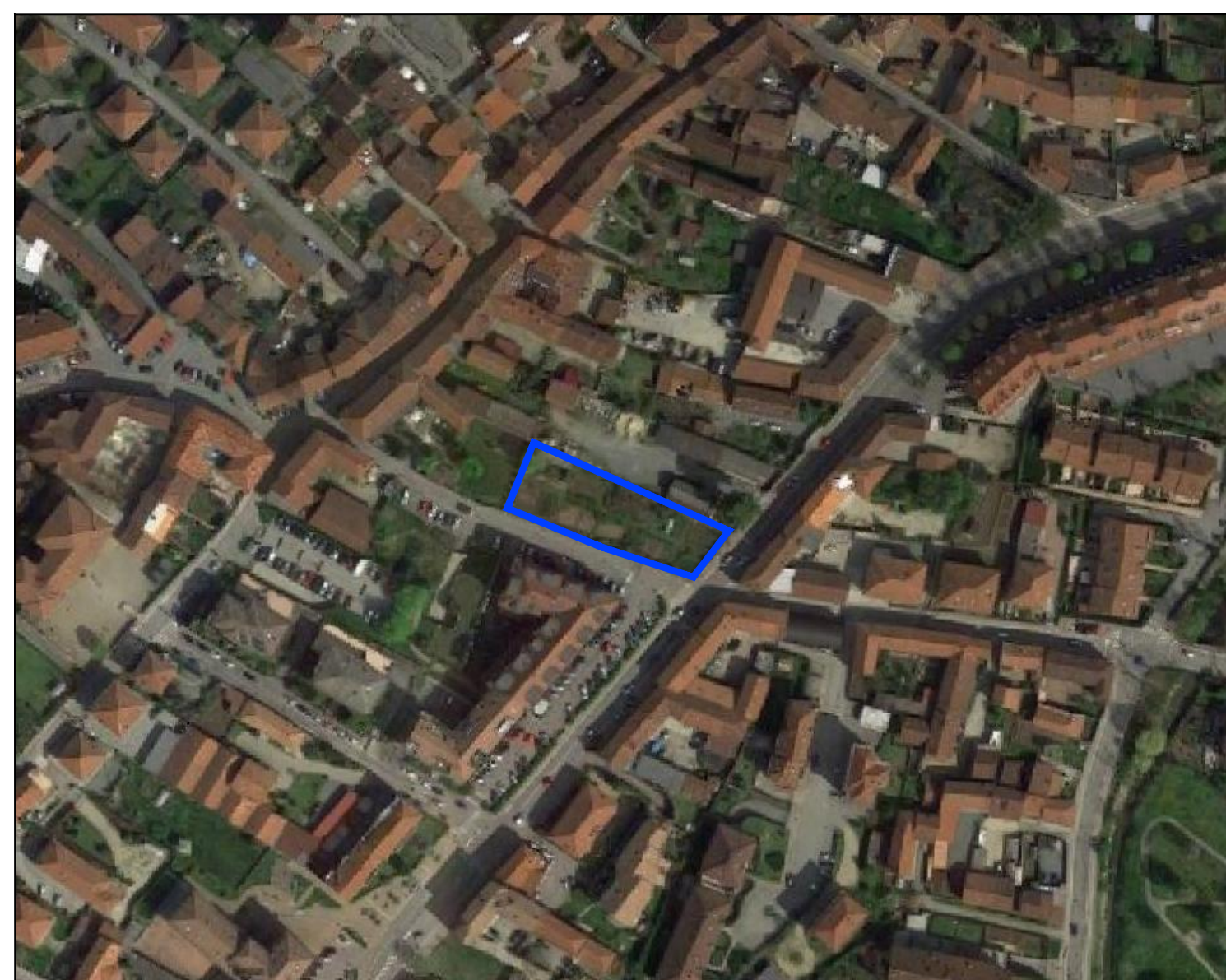
Ortofotocarta, Scala 1:2.000

Delimitazione aree soggette a convenzionamento Centri storici (art. 20/4) Limite delle aree normative Servizi pubblici progetto (art. 20/20) Area di proprietà comunale oggetto d'interesse