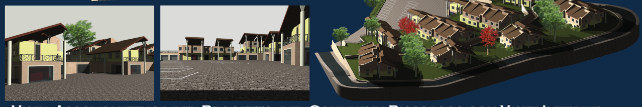
- VISTA ASSONOMETRICA DEL PROGETTO DEL COMUNE DI PIOSSASCO CON VISTE INTERNE