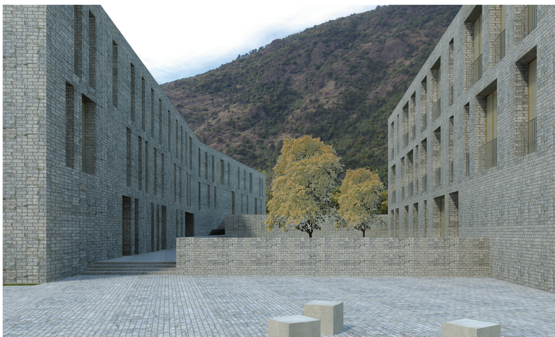
VISTA DELLE CORTI RESIDENZIALI