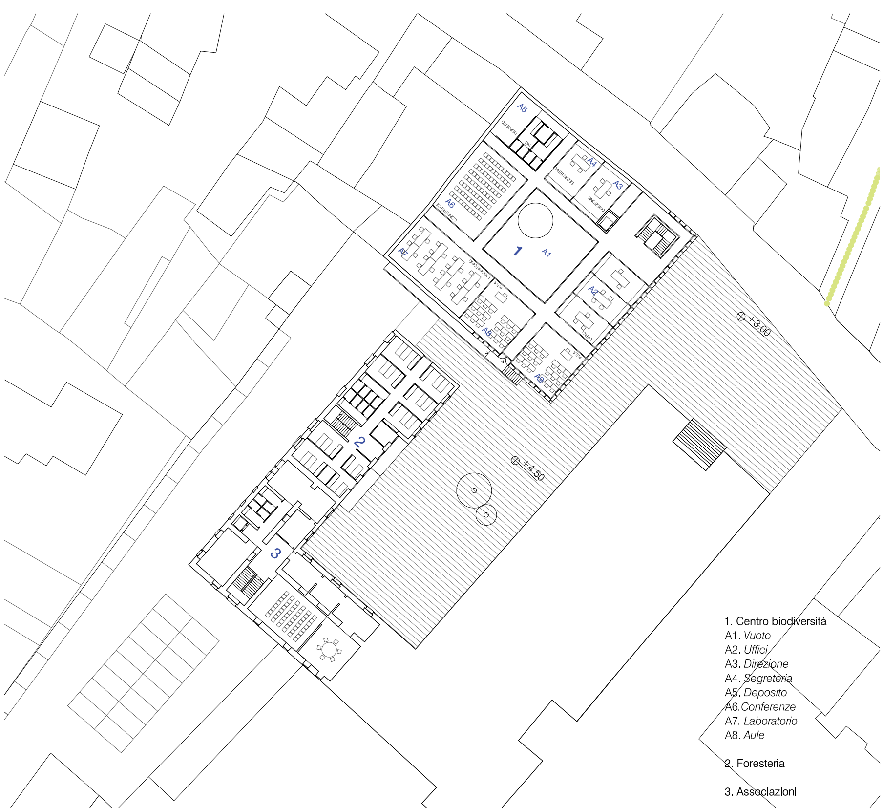
PLANIMETRIA DEL SISTEMA - PRIMO PIANO scala 1/500