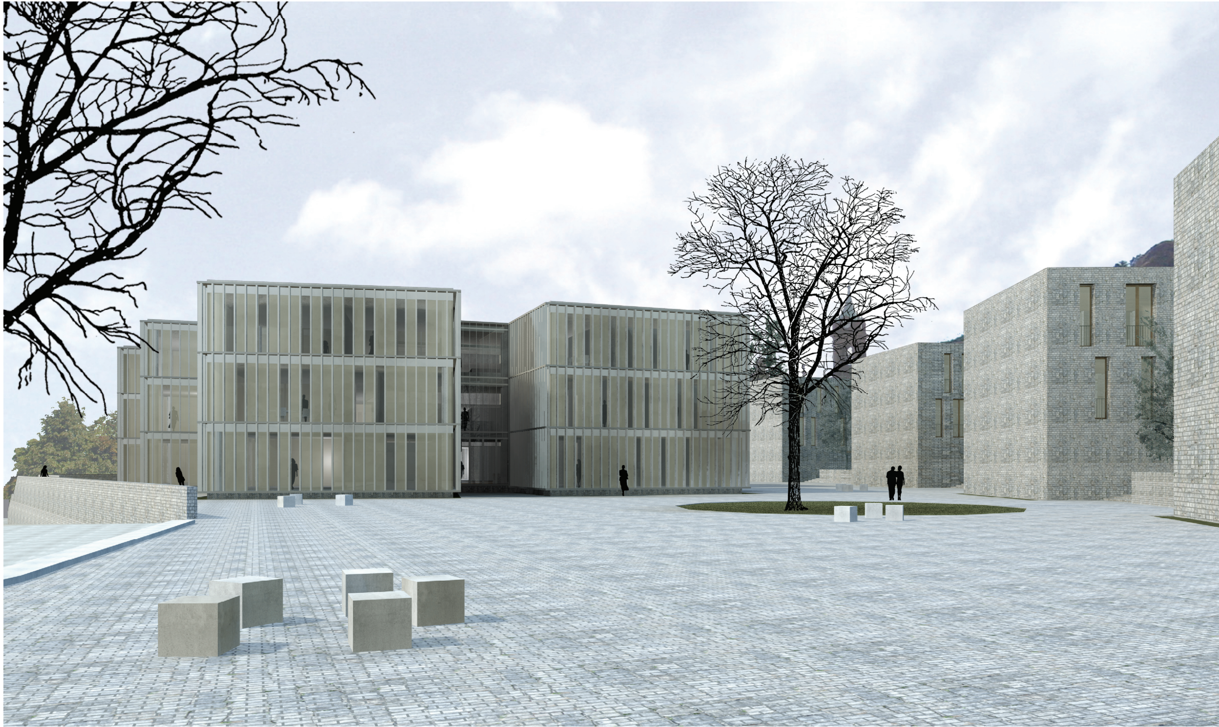
VISTA DEL MUNICIPIO