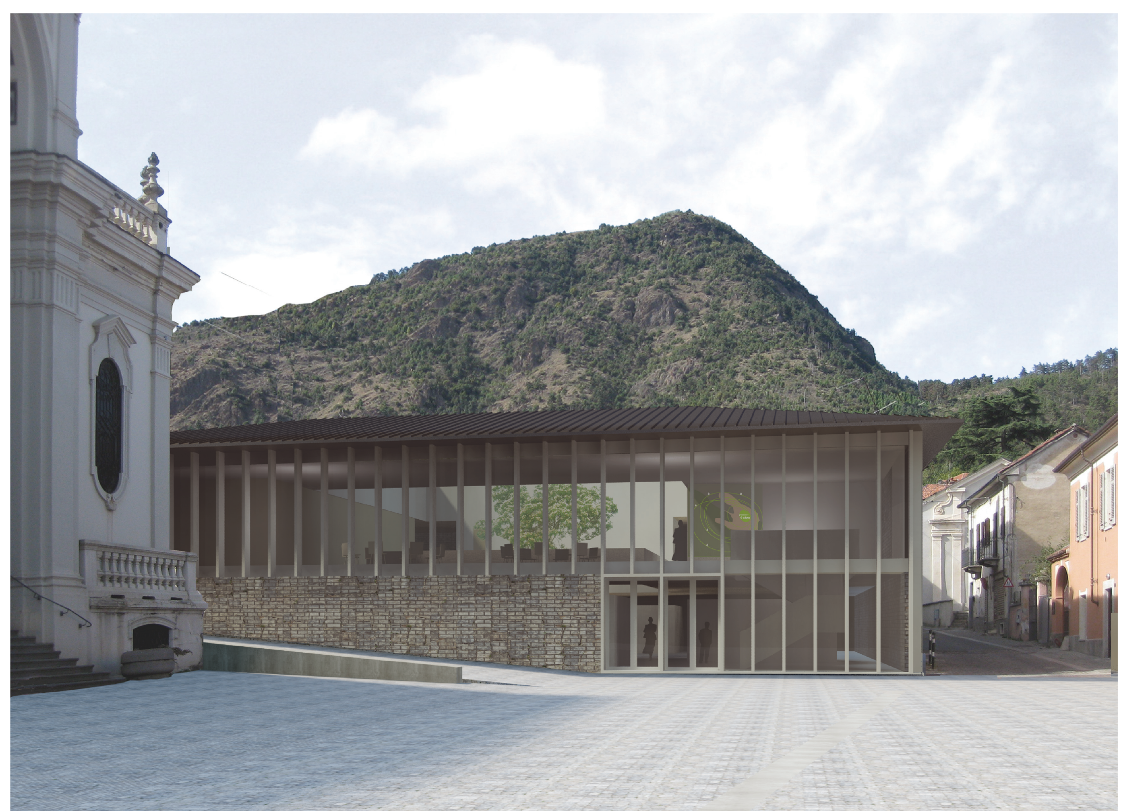
VISTA DEL CENTRO DI BIO-DIVERSITA'