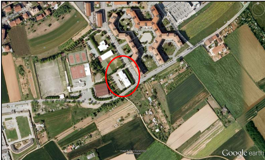
Vista aerea dell'edificio

L'accesso pedonale all'edificio scolastico avviene da Via Dante Alighieri, quello carraio da Via Nino Costa.