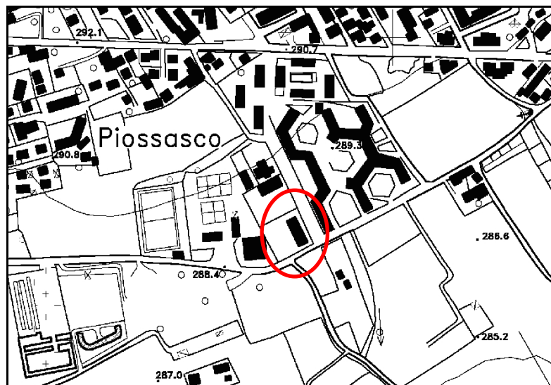
Inquadramento su Carta Tecnica Regionale