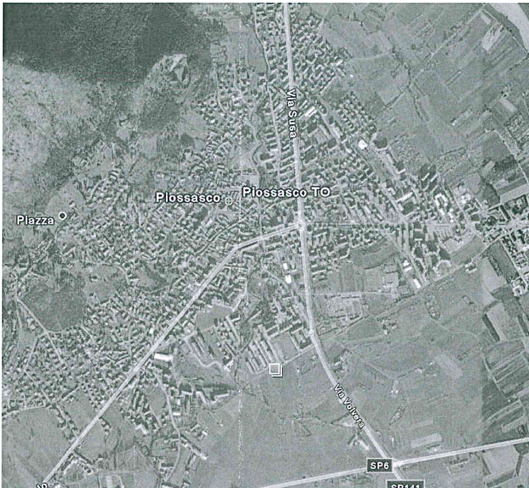
Foto aerea del centro cittadino