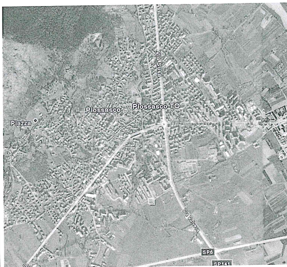
Foto aerea del centro cittadino